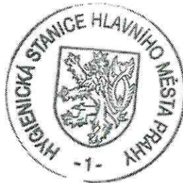
MUDr. Zdeňka Shumová ředitelka

Podle § 16 odst. 1 zákona č. 106/1999 Sb. lze proti tomuto rozhodnutí podat do patnácti dnů ode dne jeho oznámení odvolání k Ministerstvu zdravotnictví ČR prostřednictvím HSHMP.